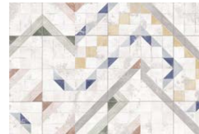
Composición con 6 piezas. Composition with 6 pieces.