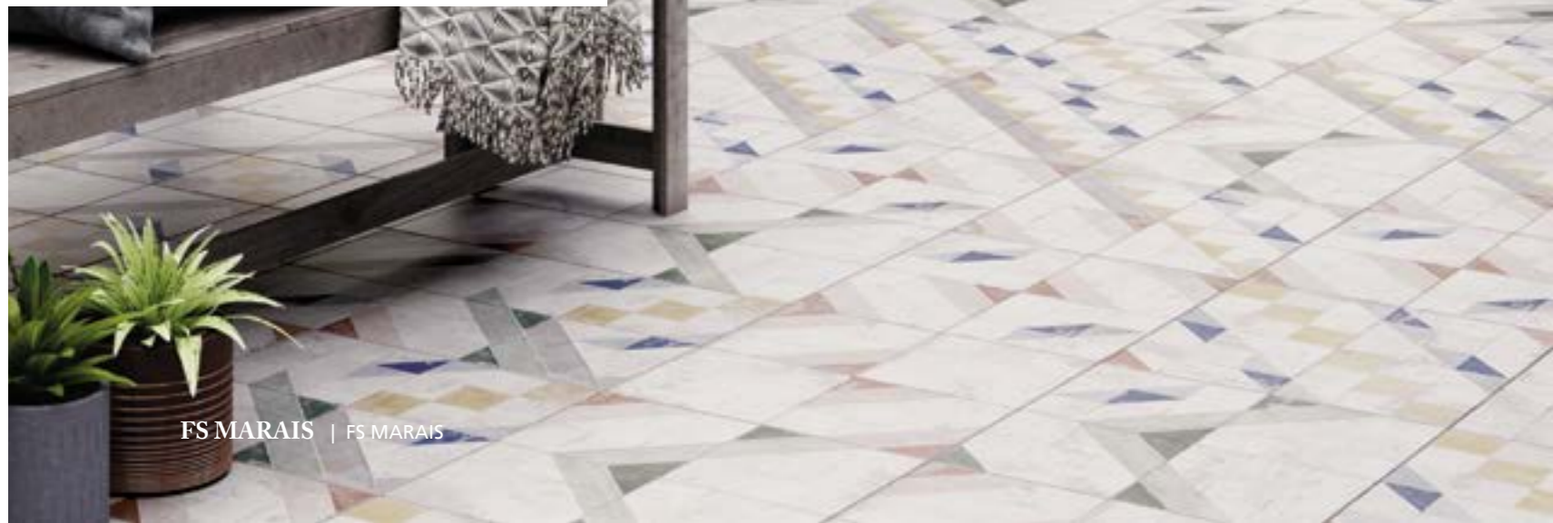
FS MARAIS | FS MARAIS